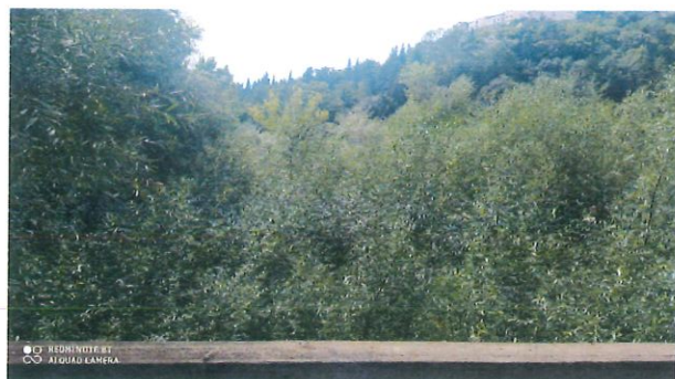
Tratto a valle della passerella pedonale

Importo complessivo progetto: € 100.000,00