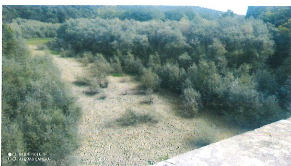
Tratto a monte della S.S.205

Allegato 3 – PLANIMETRIA C.T.R. Scala 1:10000